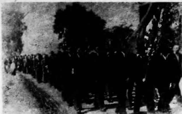
Z pietního pohřbu obětí v roce 1945

zal do kúry značku. Později byl znovu zatčen a už se nevrátil. Na základě Baronova oznámení byl po válce hrob zjištěn a byla provedena exhumace obětí.“