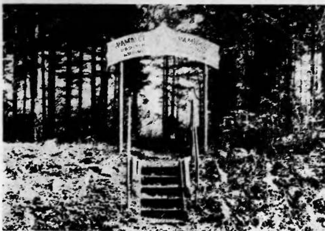
Místo zločinu v lesíku u jámy Barbora v Karviné

vlastně členové SS prohlédali oba byty, ale nikoho nenašli doma. Při domovní prohlídce u Nierostka však našli papír se jmény osob, na kterém bylo napsáno: seznam odběratelů povstaleckých novin (Gazety powstańców). Podle tohoto seznamu pak chodili esesáci do bytů a koho našli doma, toho zatkli. Já jsem toliko chodil s nimi a ukazoval jim, kde kdo bydlí. Chodili jsme pouze k osobám uvedeným na seznamu. Zatčení pak byli odvezeni na jámu Suchá v Dolní Suché. Kam byli odvezeni dále nebo co se s nimi stalo, to nevím“.