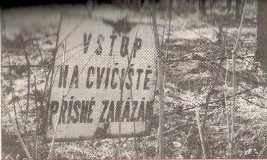
Lesík Hliník nad místeckou cihelnou si rozdělili zahrádkáři, myslivci a kynologové. Bylo právě toto místo dějištěm poprav místních Němců v roce 1945?