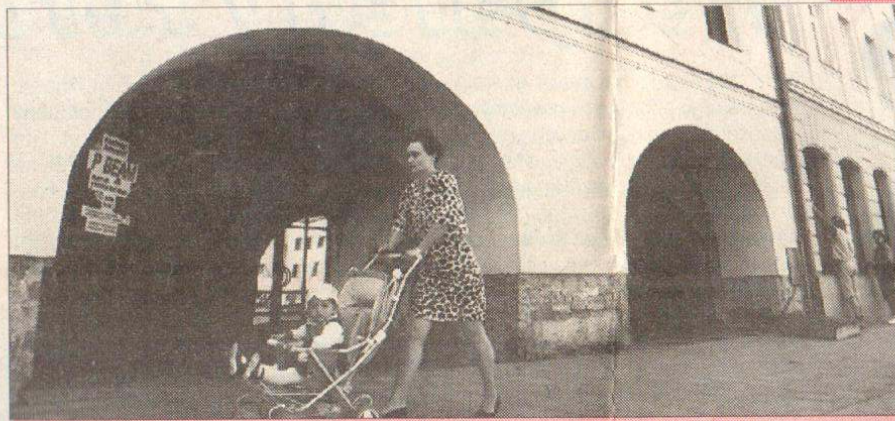
Kolem „šestnáctky“ na náměstí v Místku dnes procházejí místní občané, aniž v nejmenším tuší, co se v této budově dělo před 51 lety.

Nikdo z těchto samozvaných vykonavatelů „spravedlnosti“ nebyl za své činy brán k odpovědnosti, neboť zákon č. 115 z 8. května 1946 je této odpovědnosti zprostil. Posunul totiž až ke 28. říjnu 1945 beztrestnost jednání, jež by jinak bylo trestné, jež