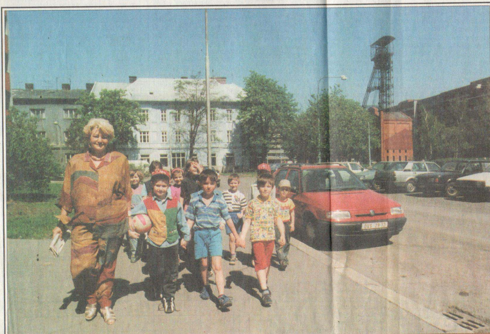
Nejen školní děti, ale ani dospělí obyvatelé Ostravy většinou nemají tušení, že poblíž nákupního střediska MANA (bývalá Volha) procházejí místem poválečného utrpení a hrůzy.