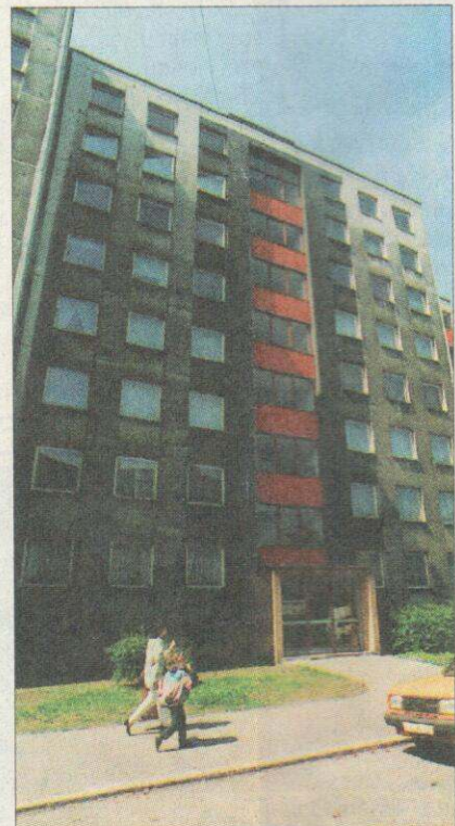
Prostor někdejší zasilatelské firmy Hanke na Nádražní ulici č. 75, kde v roce 1945 stával pověstný internační tábor.

Z obsáhlého zápisu o jednání vyšetřovací komise vyplývá, že internační tábor „Hanke“ vznikl asi 10. května 1945 a až do 13. června 1945, kdy táborovou správu převzaly řádné orgány SNB, v